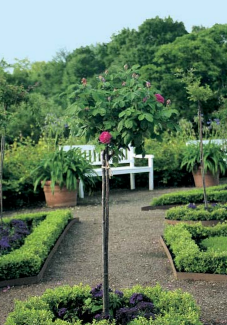
Den dejligt duftende heliotrop danner bund i de yderste bede. Heliotrop kan overvintre inden døre, men købes som regel som en sommerblomst i foråret. Bedformen er fastholdt med jernprofiler